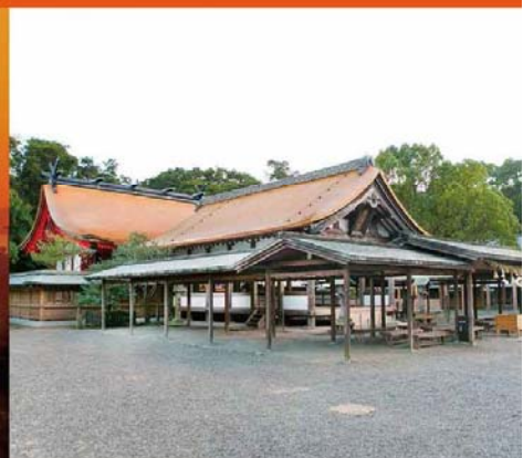
宗像大社辺津宮（宗像市）