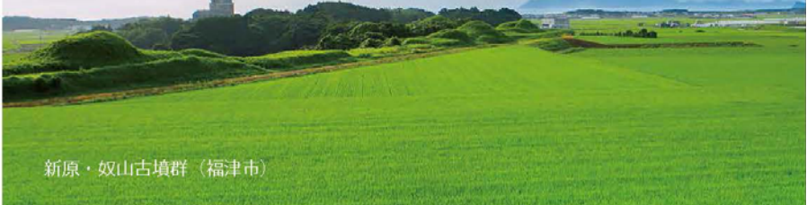
新原・奴山古墳群（福津市）

区間 第1区 宗像ユリックス～宗像大社 …………… 7.0 Km 第2区 宗像大社～勝浦浜 …………… 3.6 Km 第3区 勝浦浜～宮地浜 …………… 10.7 Km 第4区 宮地浜～福津市複合文化センター …………… 3.8 Km 第5区 福津市複合文化センター～宗像大社 …………… 10.4 Km 第6区 宗像大社～宗像ユリックス …………… 6.695 Km